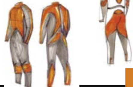
Combinaison pour véliplanchiste