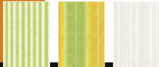
Recherche motifs textile