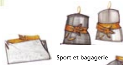
Sport et bagagerie