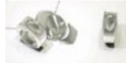
Luxe et joaillerie